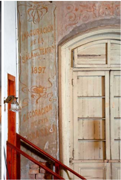
Esta inscripción es la única información escrita sobre los murales: "Decoración de esta misma sala, 1904".

Basta con entrar para darse cuenta de que se trata de un espacio que fue decorado con un propósito que iba más allá de lo estético: expresa la importancia que se le daba en la época a la difusión de la cultura y el arte en todo ámbito. Los doce murales de gran formato incluyen paisajes, retratos de artistas clásicos y alegorías de musas griegas, también personajes históricos vinculados a la Casa de Orates y distintos motivos decorativos. "Estamos frente a una obra de arte colectiva donde se aprecia claramente la presencia de por lo menos 'dos manos' al momento de su ejecución. Indicio de esto resultan los diferentes estilos, temáticas y facturas que pueden ser reconocidos en las pinturas", explican.