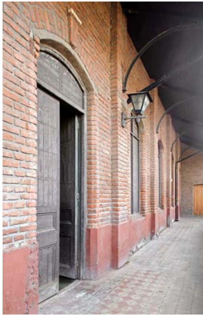
Lateral exterior del edificio, levantado en 1897, también de arquitecto desconocido.