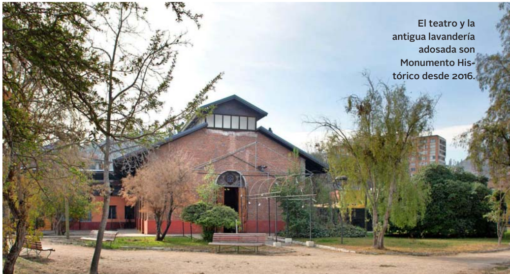
El teatro y la antigua lavandería adosada son Monumento Histórico desde 2016.