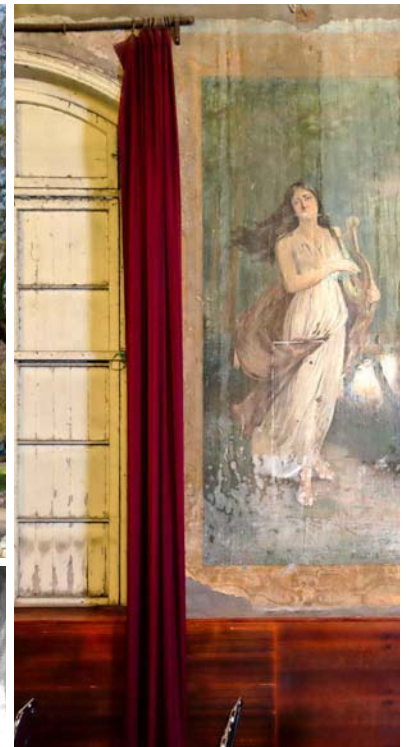
Erato, musa de la poesía lírica, falso fresco, 1904.

D entro del Instituto Psiquiátrico José Horwitz Barak se esconde una joya patrimonial que justamente hoy, 4 de julio, está cumpliendo 129 años. Se trata del Teatro Grez, un salón que formaba parte de la entonces llamada Casa de Orates y que fue creado bajo una novedosa perspectiva de tratamiento para los enfermos a través del arte. Iniciativa que a fines del siglo XIX era toda una revolución en el país y que fue posible gracias a su principal benefactor, Manuel Silvestre Grez. Monumento Histórico desde 2016, el edificio aún está en uso, aunque su estado actual contrasta bastante con el esplendor que tuvo en las primeras décadas de 1900, cuando convocaba a centenares de personas de la alta sociedad y ahí se presentaban importantes exponentes de la música,