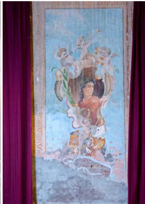
Falso fresco es la técnica de estas pinturas; retrato del poeta romano Virgilio.