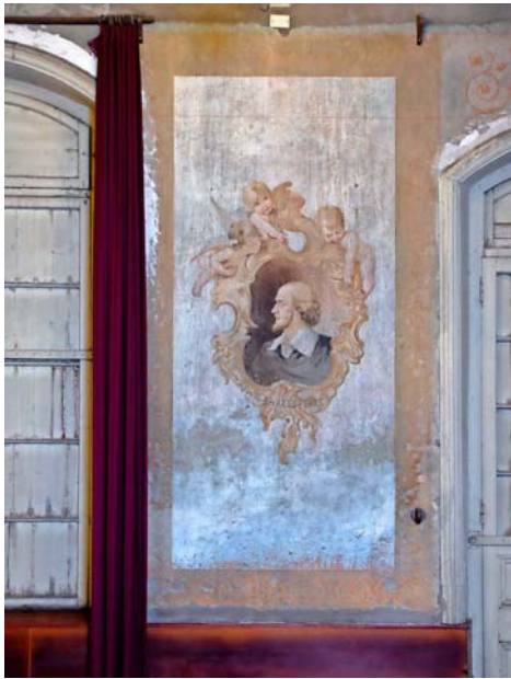
Retrato de Shakespeare, uno de los ocho artistas clásicos presentes en el teatro, sin firma.