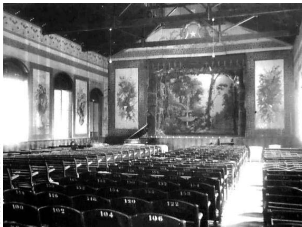
Las butacas originales de madera fueron reemplazadas por sillas, y los antiguos murales de los costados del escenario, por paneles de yeso.

UNIDAD DE COMUNICACIONES DEL INSTITUTO PSQUIÁTRICO DR. JOSÉ HORWITZ BARAK