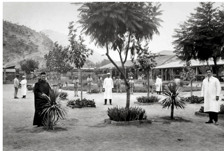
Patio de la Casa de Orates