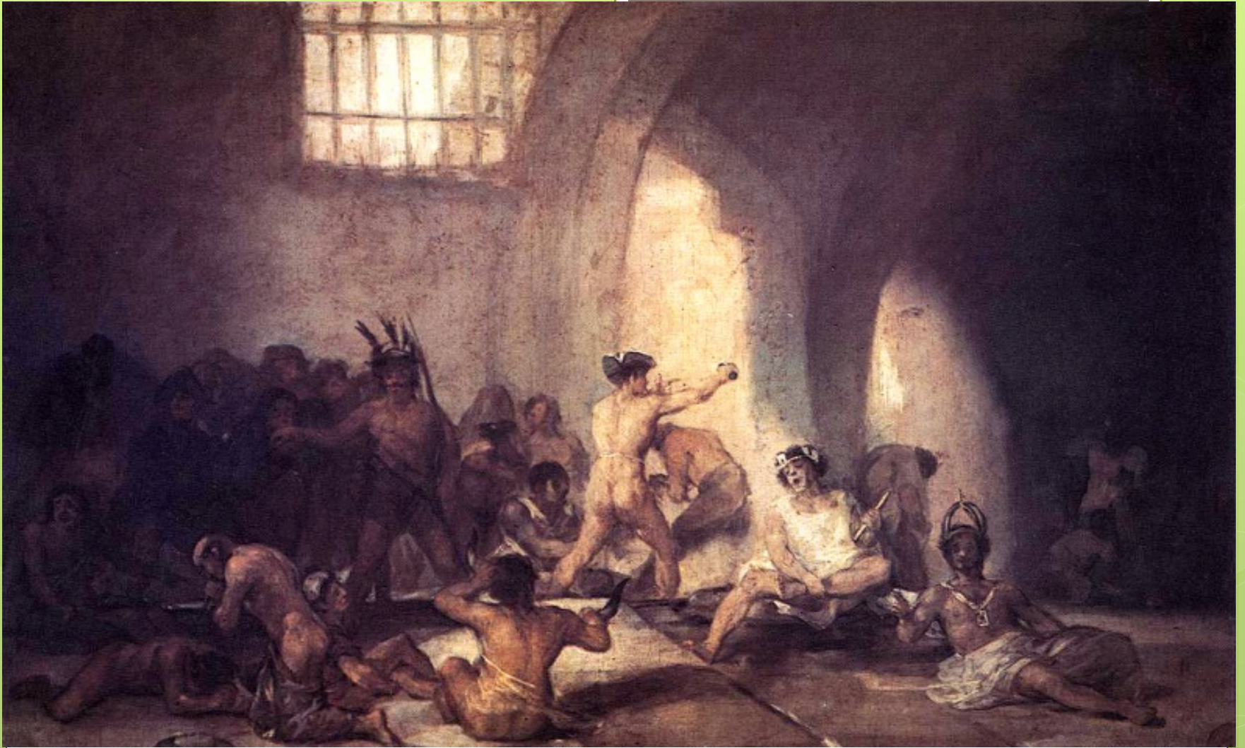
Casa de locos Goya comienzo s XIX