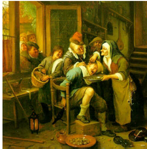
Extracción de la piedra de la locura