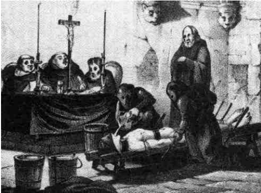
Tormento del agua